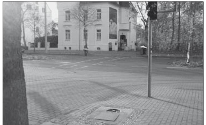
Bild 2: Ehemaliger Standort einer Wasserpumpe, Magnusstraße/Delitzscher Str.