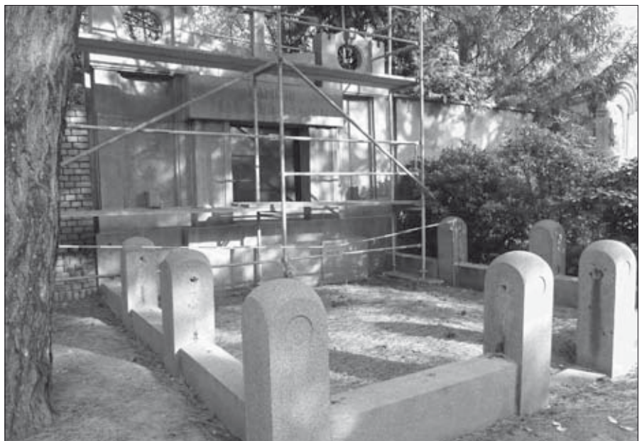
Wandstelle Reinshagen (Zustand im Oktober 2012), gestaltet von Otto Paul Burghardt