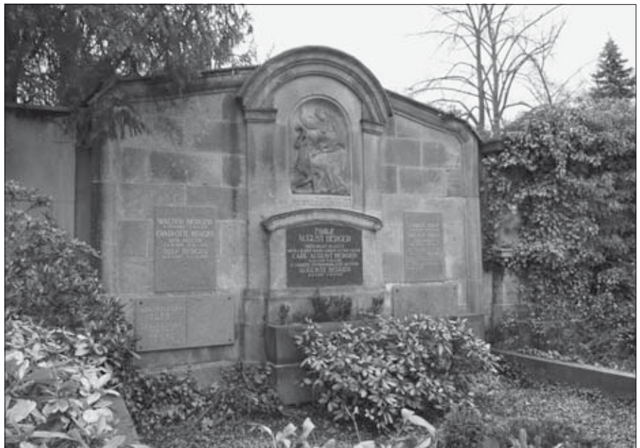
Wandstelle der Fuhrwerksbesitzer Berger

Erwähnenswert wäre noch die Wandstelle 84 des Kaufmanns Max Reinshagen . Interessant ist, dass sie vom Architekten Otto Paul Burghardt geschaffen wurde. Zu seinen wichtigsten Werken in Leipzig zählen das Europahaus am Augustusplatz, die 1906/07 erfolgte Rekonstruktion des Romanushauses, die Rennbahntribüne im Scheibholz und etliche Wohnhäuser in der Springerstraße.