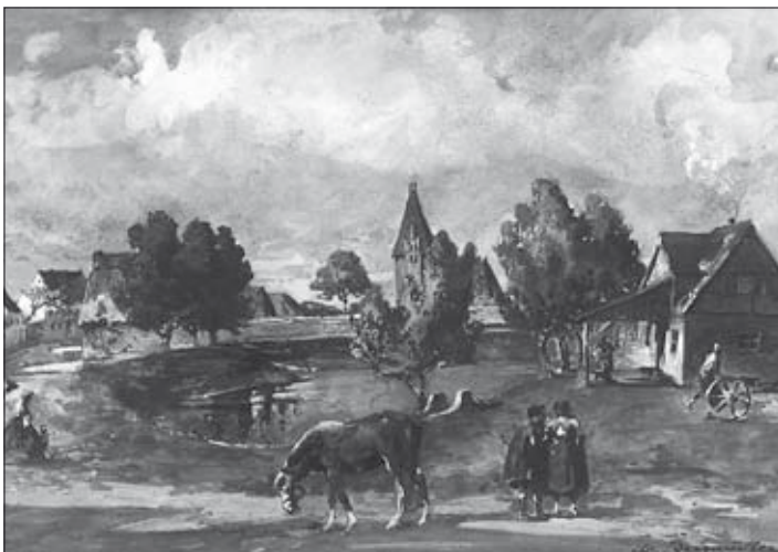
Bild 24: Alt-Eutritzsch, Eingang Gräfestraße (Zeichnung aus dem 19. Jahrhundert, Herkunft nicht ermittelt)