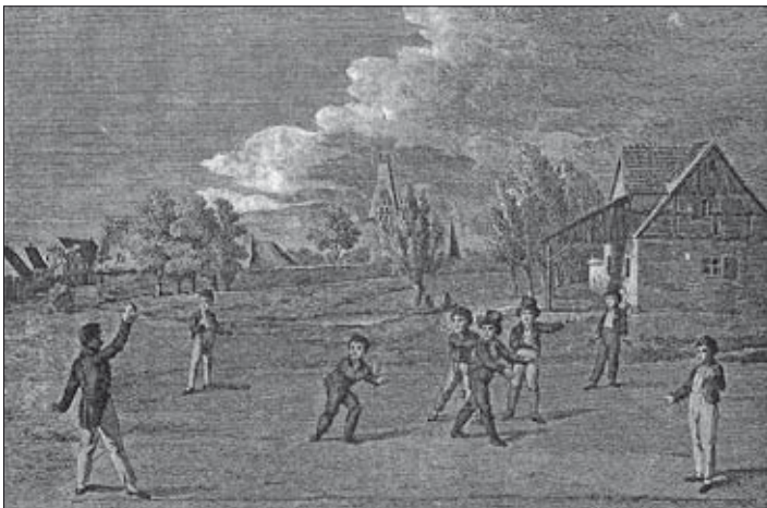
Bild 23: Alt-Eutritzsch, Ballspielende Knaben in Eutritzsch (entnommen aus Wustmann, /30/, Zeichnung von C. G. H. Geißler aus dem Jahre 1808)

Literaturquellen siehe Ausgabe 178/Juni 2012