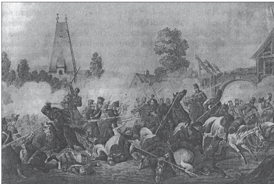
Bild 20: Schlacht um Wiederitzsch (16. Oktober 1813), (entnommen aus Donath/Füßler, urspr. Zeichnung von Strassberger)

Am meisten litt die Wiederitzscher Einwohnerschaft, denn alles zum Brechen und Beißen in den Bauernhäusern war geplündert worden. Selbst die roh ungenießbaren Win-