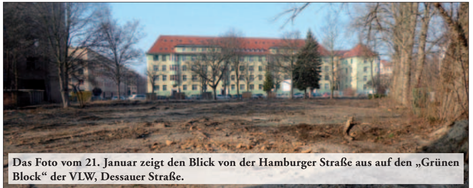
Das Foto vom 21. Januar zeigt den Blick von der Hamburger Straße aus auf den „Grünen Block“ der VLW, Dessauer Straße.

Die Gebäude auf dem Areal an der Dessauer/Hamburger Straße wurden im Dezember 2018 vollständig abgerissen und es sollen nun Bodenuntersuchungen stattfinden. Die Flurstücke gehören der CG-Gruppe und es ist wohl eine Wohnbebauung geplant, die dann vom Hamburger Bogen bis zum ehemaligen Flinsch-Haus reicht. Die Planungen sind zurzeit noch nicht spruchreif, wie wir auf unsere Anfrage hin erfuhren. J.W.