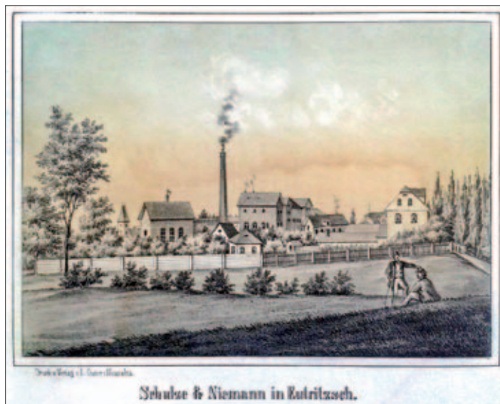
Schulze & Niemann in Eutritzsch, um 1860

Anzeige aus „Leipziger Zeitung“ vom 7. November 1850 (Firmensitz in Leipzig, Grimmaische Straße 16 / Mauricanum)