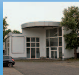
Delitzscher Straße 95

Eine Datei als .svg oder .dxf erstellen oder aus dem Netz laden und lasern lassen.