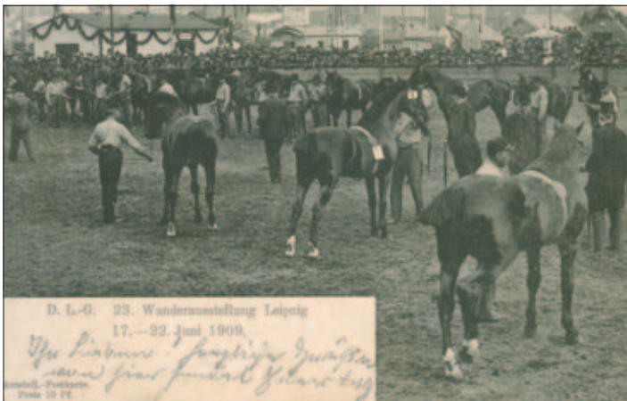
Pferde auf der Ausstellung

Nummer 4232 des Auftragsbuches: Landwirtsch. Ausstellung, Leipzig 1909, Pferdestall