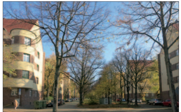
Situation am Haupteingang heute, Blick in die Thaerstraße